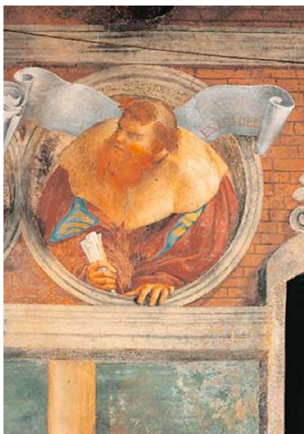
De profeet Ezechiël van Lotto Lorenzino (fresco)

Mailen kan ook: schuldhulpmaatje.utrecht@gmail.com