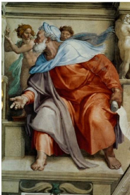
De profeet Ezechiël, door Michelangelo