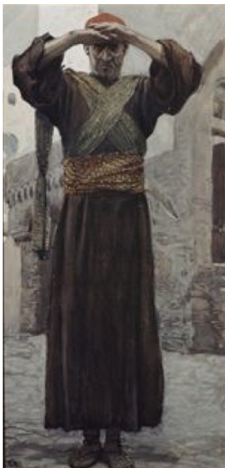
Ezechiël van James Tissot,