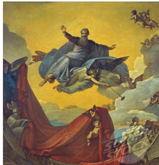
The Vision of the Prophet Ezekiel Shebuev, Vasili

Ik vond het een mooi verhaal. En ik dacht bij mezelf: Mensen moeten niet zo doen als die wijnstok. Ze moeten zichzelf niet te groot willen maken. En niet altijd maar meer willen hebben. Wees liever tevreden met wat je wél hebt.